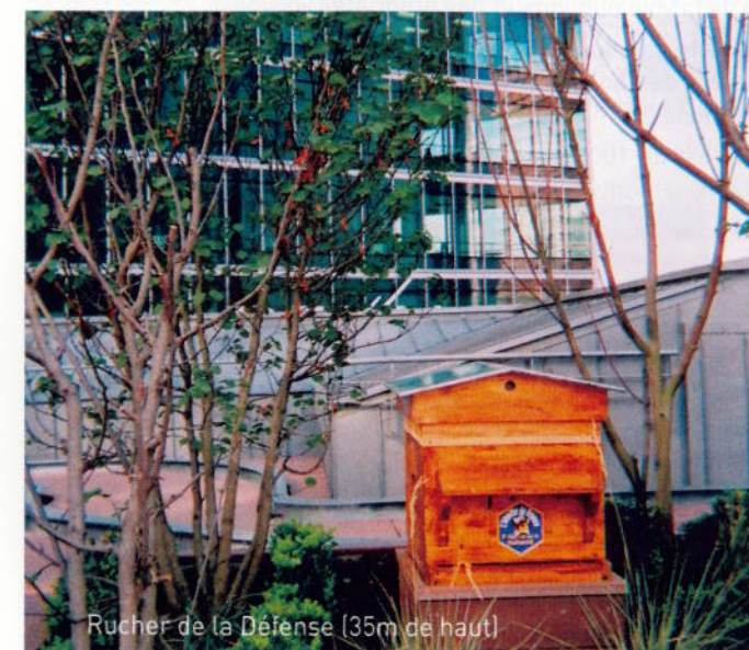
Rucher de la Dôlesse (35m de haut)

Toutefois, cette distance pourra être réduite à 3 m si le rucher se trouve entouré d'une haie ou d'un mur forçant les abeilles à s'élever immédiatement au moment où elles prennent leur vol.